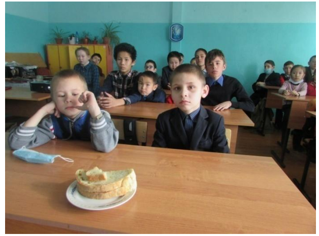
Цикл мероприятий, посвященных 5-летию воссоединения Крыма и Севастополя с Россией: